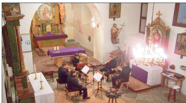
Adventní koncert v kostele