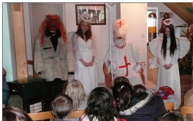
Mikulášská nadílka v Dolanech