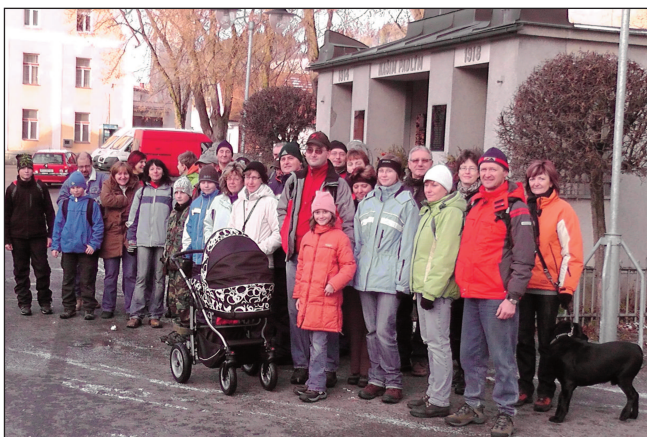
Dobýt nedaleký vrch Věvec se na Silvestra vydaly desítky lidí nejen ze Čkyně. Mezi nimi i asi třicítka turistů, kteří jsou na snímku. (pp)