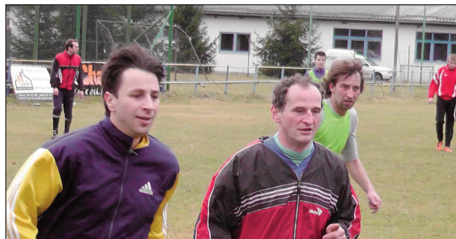
Fotbal nevynechali ani na Nový rok