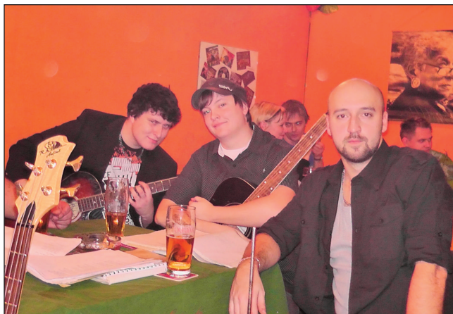
Sehraná trojka čkyňských rockerů