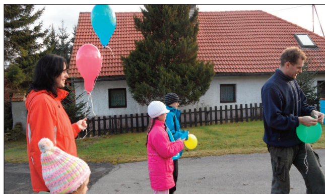
Vypouštění balónků Ježíškovi