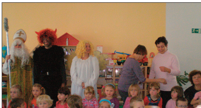
Mikulášská besídka v mateřské škole