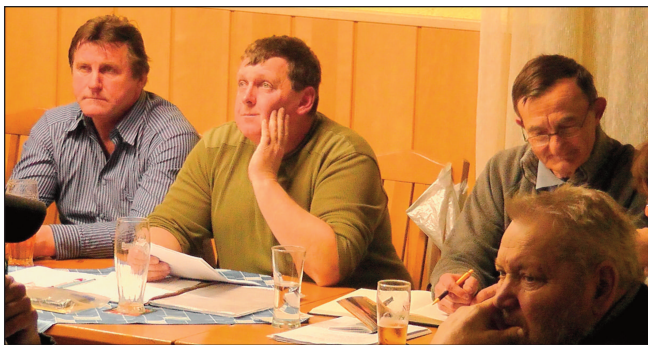
Schůze čkyňských rybářů