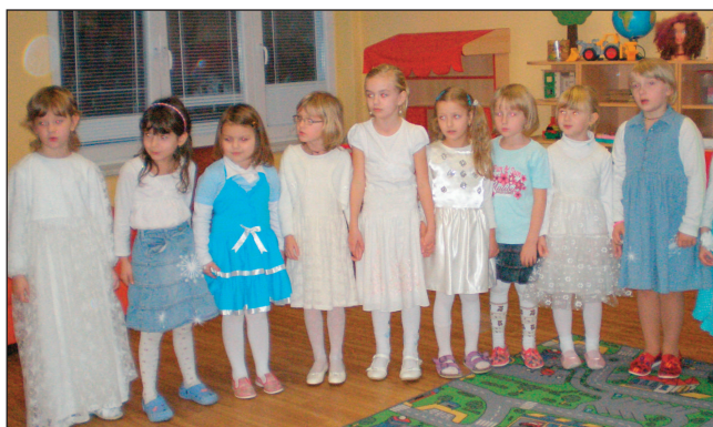
Vánoční besídka v mateřské škole